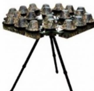
Рис. 4 - Переносной (стационарный) комплекс противодействия БВС "Купол-про"

Наиболее эффективным на сегодняшний день в борьбе с БАС, БВС (дронами, коптерами) является переносной (стационарный) комплекс противодействия БВС всенаправленного действия 360° x 180° (рис. 4). При включении мгновенно создается "непроницаемая" для БАС, БВС (дронов, коптеров) защитная полусфера радиусом не менее 2 км одновременно в 10 частотных диапазонах.