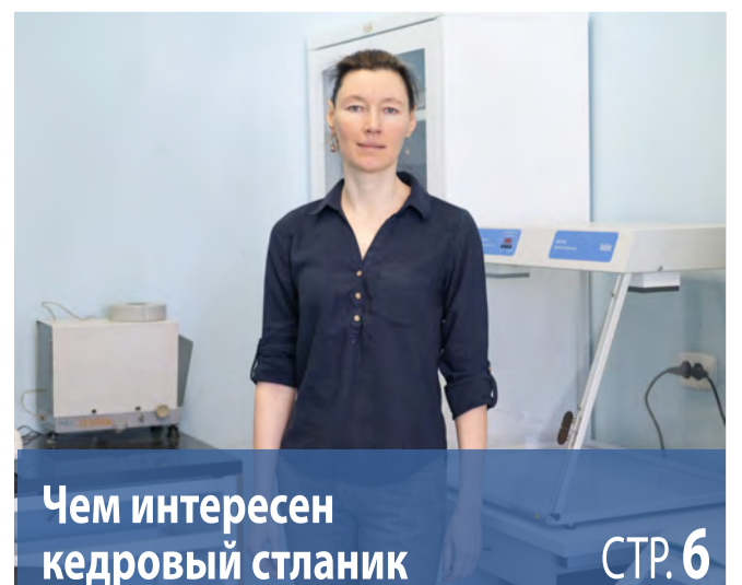
Чем интересен кедровый стланик