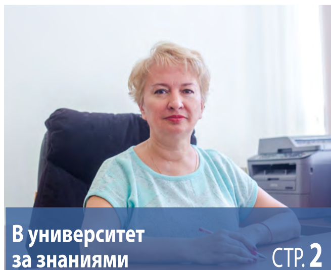
В университет за знаниями